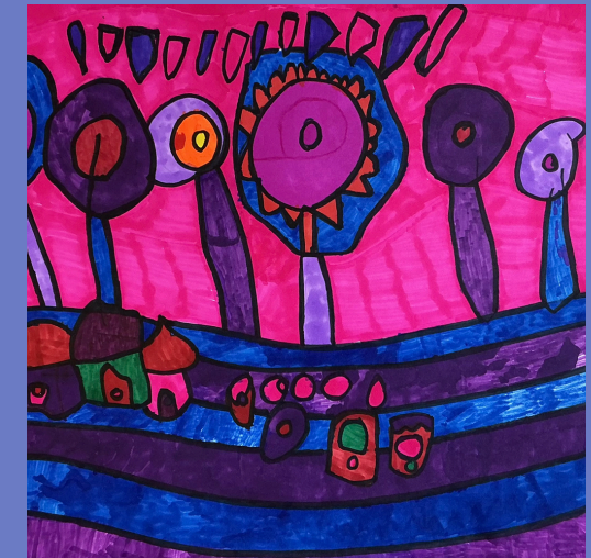
Huntervasser Village - Isabelle L.